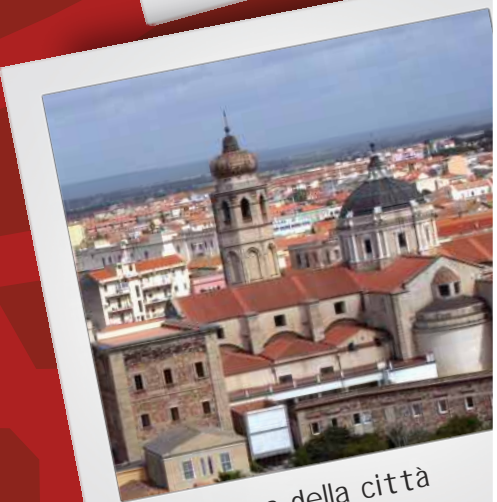
Panorama della città