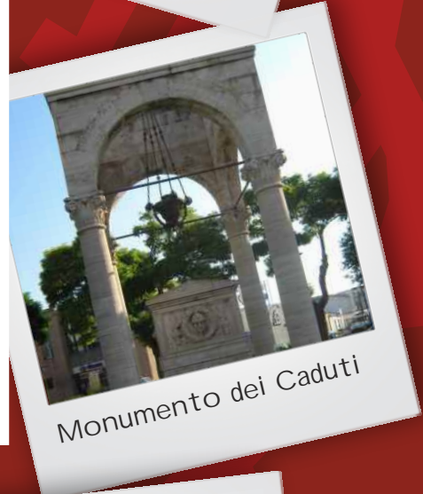
Monumento dei Caduti