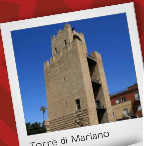
Torre di Mariano