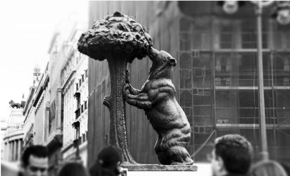
Madrid Puerta del Sol - Cagliari Torre dell'Elefante