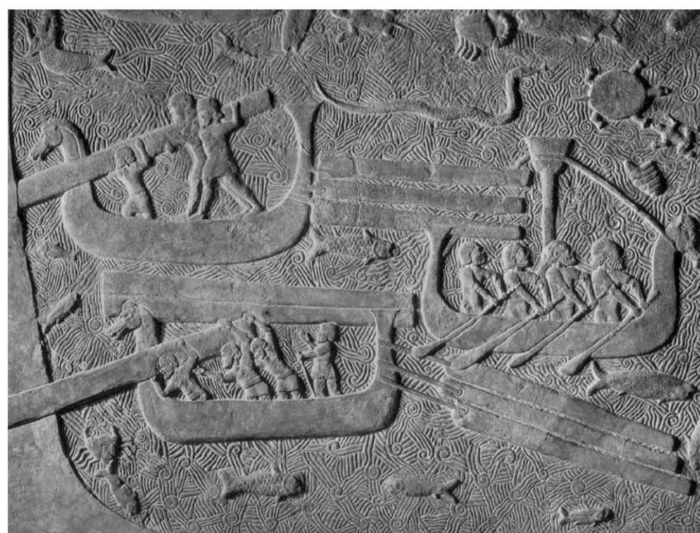
Basorilievo con navi fenice del palazzo di Sargon II Ninive (Khorsabad) da AA.VV., PHOINIKES B SHRDN, Cagliari - Oristano, 1987

Oristano 19/20/21 maggio 2007 Auditorium San Domenico Via Lamarmora